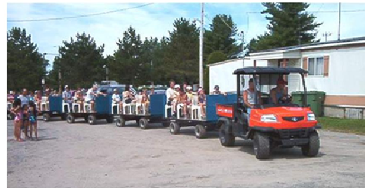
Petit train très apprécié des petits comme des grands